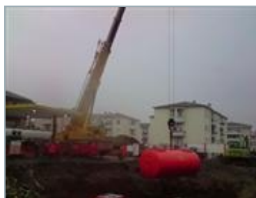
TREZZO SULL'ADDA (MI) Via Brasca